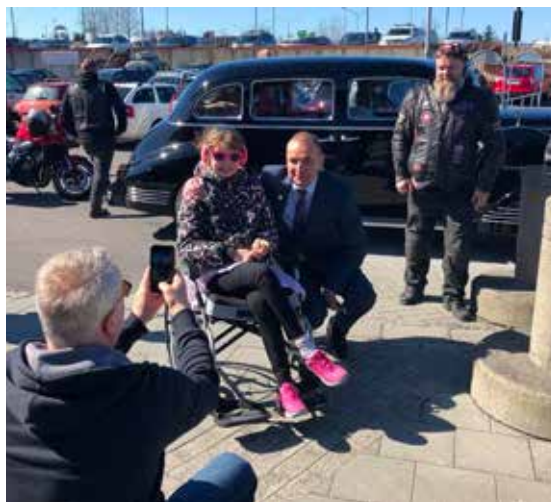
Forseti Íslands Guðni Th. Jóhannesson mættur til að starta landsöfnun félagsins og keypti fyrstu lyklakippuna af ungu söluólki.

Samtökin halda úti reglulegri Vitundarvakningu og í ár fengum við frábæran stuðning. Nokkrir nemendur Kvikmyndaskólans settu saman auglýsingu. Þar sem þekktir einstaklingur úr samfélaginu tóku þátt í að vekja fólk til umhugsunar með slagorðinu, „Ef þú sérð eitthvað gerðu eitthvað“. Með því var verið að vekja fólk til umhugsunar um að stöðva ofbeldi. Til þess þarf