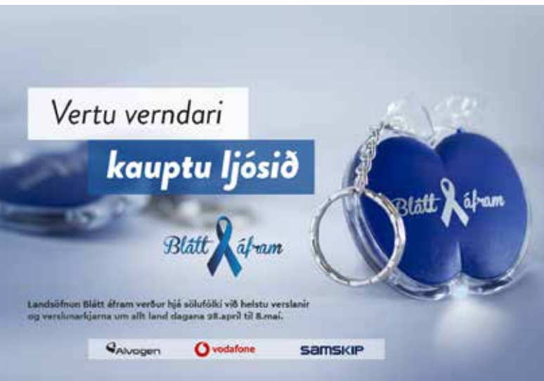
Landsöfnun félagsins 2018 styrkt af Alvogen.

Árlega stendur Blátt áfram fyrir landsöfnun til að halda baráttu félagsins áfram fyrir vernd barna gegn kynferðisofbeldi. Með söfnun er einnig verið að vekja athygli á alvarleika kynferðisafbrotu á börnum og að gæta þurfi að velferð barna í hvívetna. Lyklakippan í ár sem Blátt áfram bauð til sölu var epli. Forseti okkar Guðni Th aðstoðaði við að starta söfnuninni þar sem hann kom akandi á elsta forsetabílnum í fylgd mótörhójakappa B.A.C.A (Bikers against child abuse).