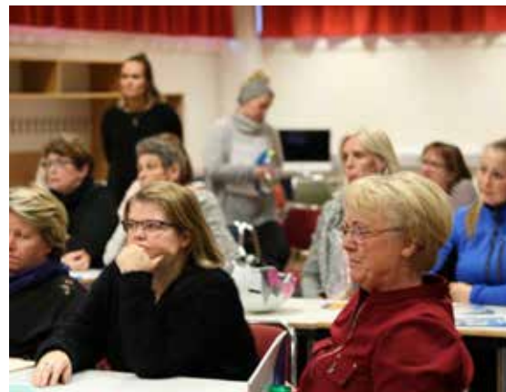
Námskeiðið Verndarar barna haldið á Höfn í hornafirði fyrir kennara.

Markmið námskeiðsins Verndarar barna, er að kenna einfaldar leiðir til að vernda börn gegn kynferðisofbeldi. Leiðirnar felast í mikilvægum skrefum til