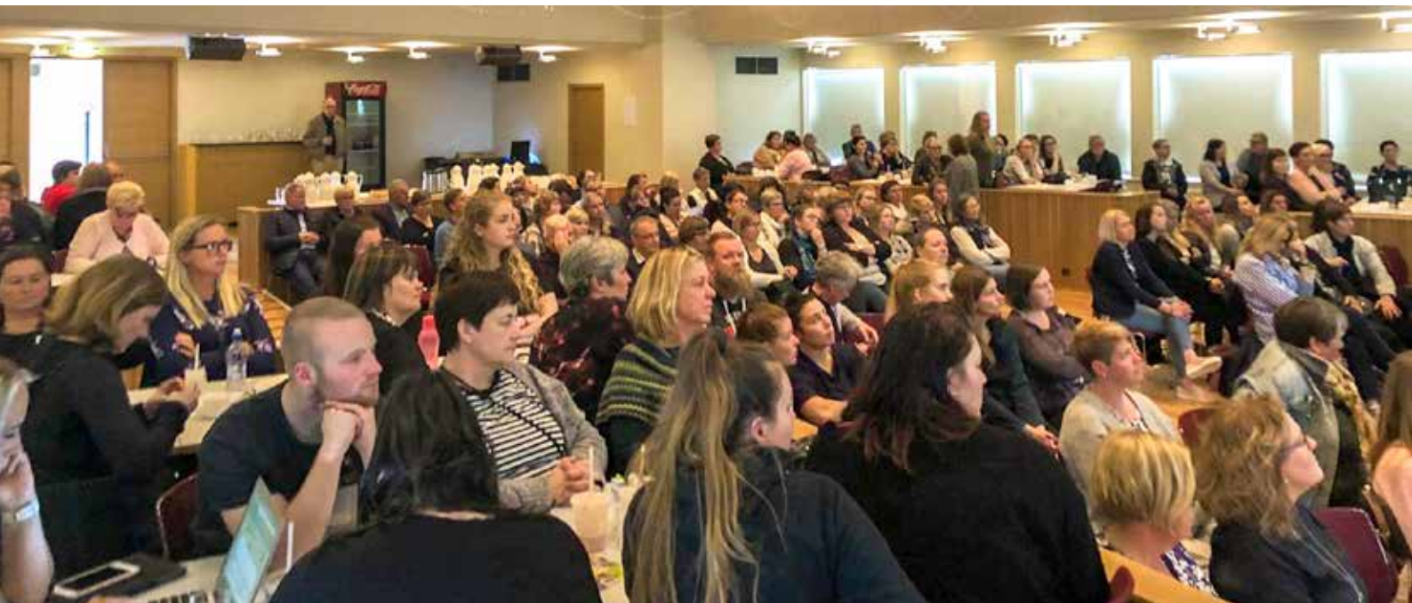
Fjöldi manns frá Skagafirði og nágrenni hlýddu á fræðsluerindi samtakanna um forvarnir gegn kynferðisofbeldi.