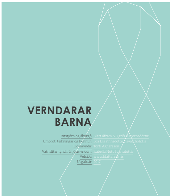
Efnið Verndarar barna, vinnubók, 5 skrefa bæklingur og myndefni

að auka vitneskju um hvernig megi koma í veg fyrir ofbeldi, hvernig bregðast megi við, ásamt upplýsingum um hvernig tilkynna á grun um ofbeldi. Ofbeldi gegn börnum er af mannavöldum og er því hægt að fyrirbyggja!