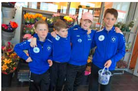
Ungir krakkar í Stjörnuni seldu lyklakippu ljós til styrktar samtökunum.

Unga kynslóðin lét til sín taka með því að útbúa auglýsingaherferð sem var dreift víða á netinu.