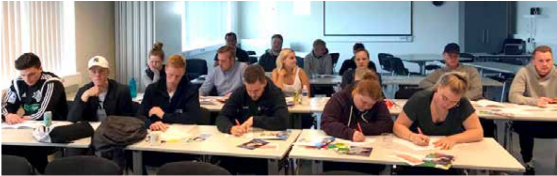
Námskeið VB á Akureyri